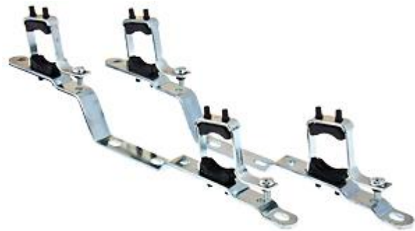
ПАРА КРОНШТЕЙНІВ КОЛЕКТОРНИХ

Виробник: VALTEC s.r.l., Via Pietro Cossa, 2, 25135-Brescia, ITALY